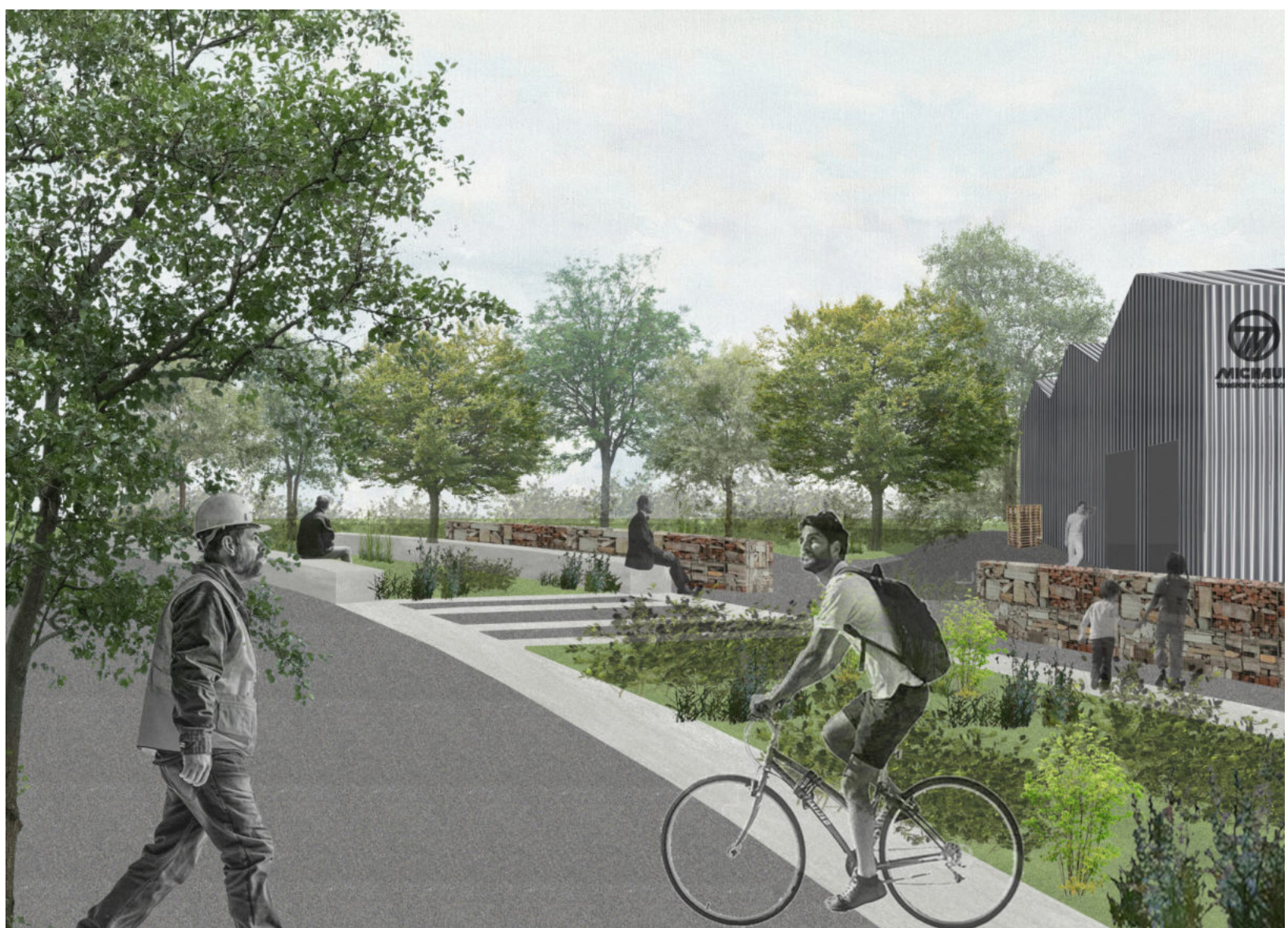
Vue du jardin des rails