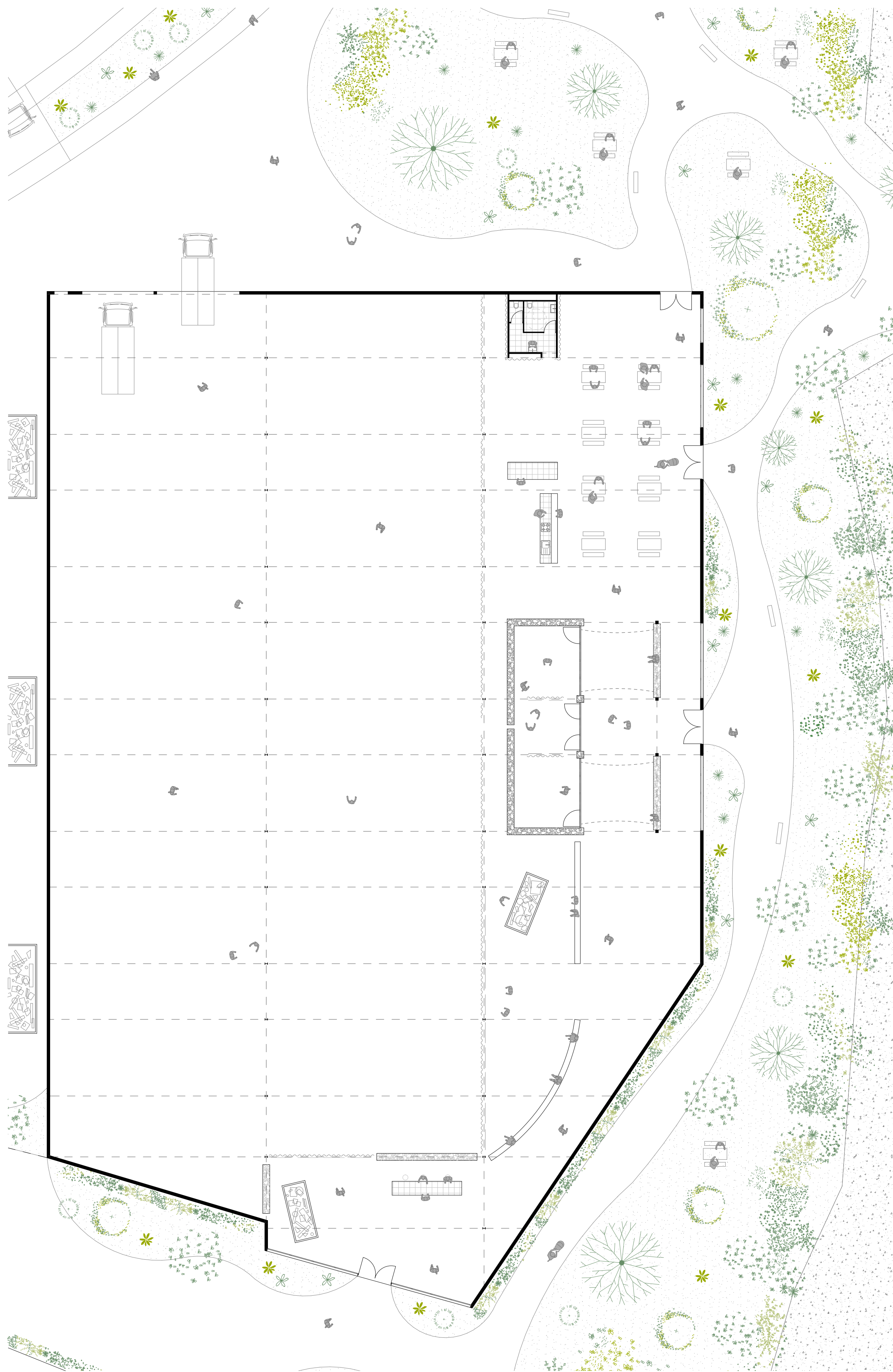
Plan du Rez-de-chaussée de la Halle n°2 | 1 : 200 e ①