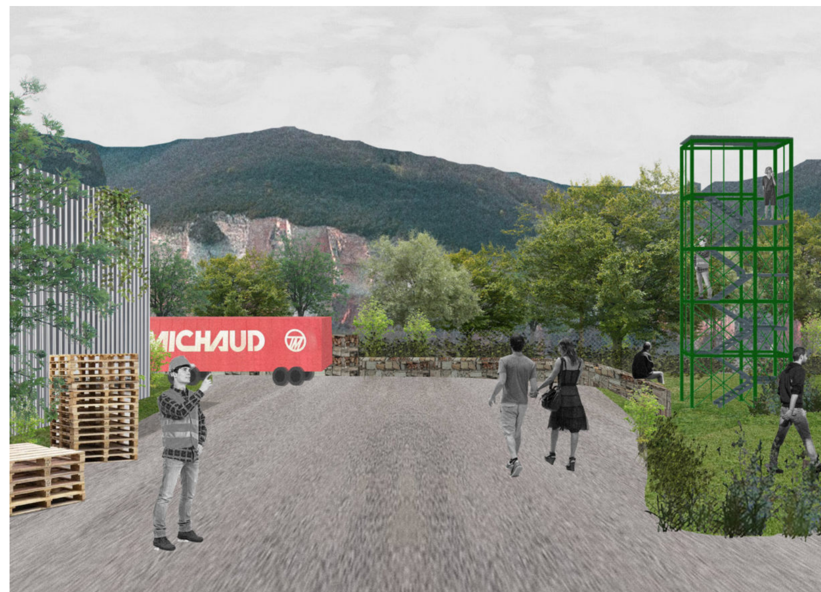
Vue du Bévière