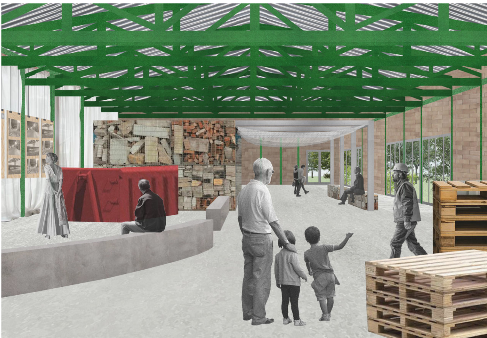
Vue de la Halle n°2