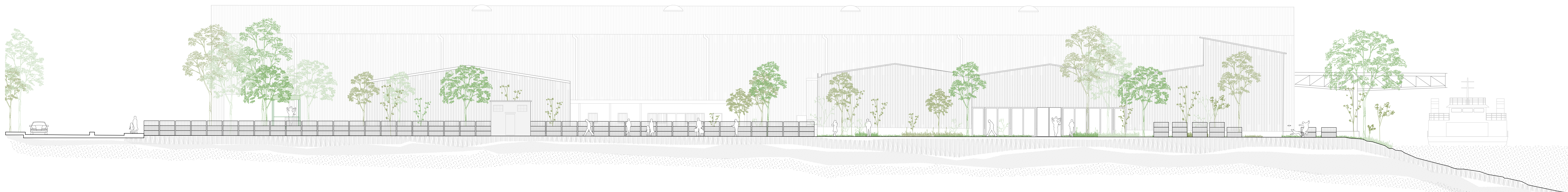
Élévation BB' | 1 : 200e